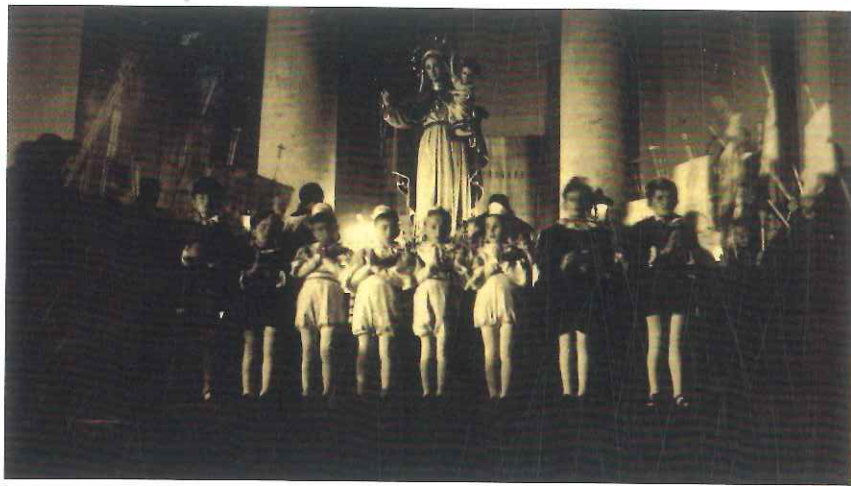
1948, la Madonna Pellegrina nella Villa. Anonimo.