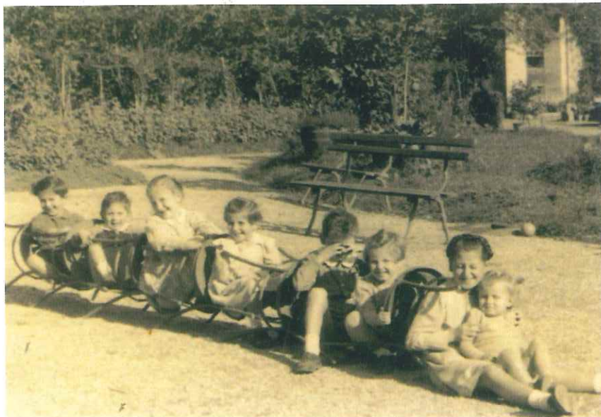
Il treno dei bambini nel 1945.