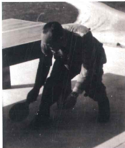
Ufficiali tedeschi giocano a ping-pong a Villa Arnò, primavera 1945.